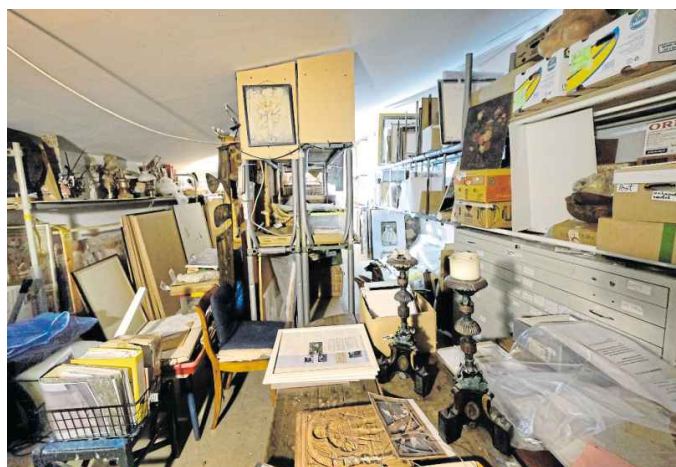
Im Archiv: Skulpturen, Früh- und Spätwerke, Skizzen und Notizen – Tausende Arbeiten warten auf neue Entdeckungen.