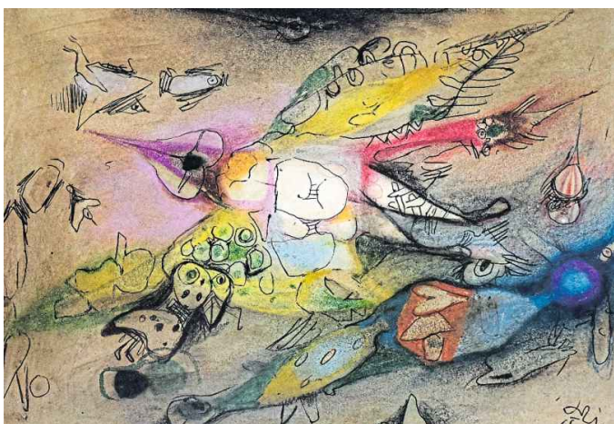
Fantastische Szenarien, präzise komponiert: Jede Linie führt in eine weitere Ebene der Wahrnehmung.

Sie zeigt einen Künstler, der die Dresdner Moderne mit westfälischer Erdung verband, der aus Brüchen Bildwelten formte und unbeirrt daran glaubte, der Welt durch Kunst eine tiefere Dimension hinzuzufügen. Woldemar Winklers Surrealismus war kein Eskapismus. Er war eine Form von Genauigkeit – und eine leise, beharrliche Antwort auf die Zumutungen des Jahrhunderts.