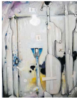
Verschachtelte und poetische Verwandlungen: Winklers Bildräume öffnen sich erst auf den zweiten Blick.

waren seine Spielwiese. Figuren tauchen auf, winzig klein, verschachteln sich, lösen sich auf. Wer ein Winkler-Bild besitzt, entdeckt oft noch Jahrzehnte später neue Details.