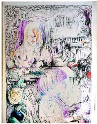
Feinlinig und konzentriert: In der Zeichnung verdichtet sich Winklers Blick auf das Unsichtbare im Sichtbaren.