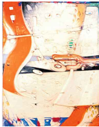
Zwischen Traum und Wirklichkeit entsteht eine Bildwelt, in der das Kleine monumentale Bedeutung gewinnt.