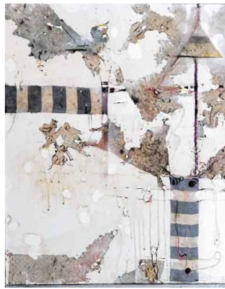
Aus Spur und Struktur wächst ein Kosmos – Winklers Surrealismus lebt von leisen Irritationen.