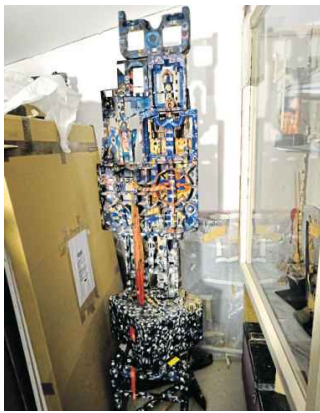
Menschengroß und von stiller Präsenz: Eine Skulptur, die den Raum nicht beherrscht, sondern ihn verwandelt.